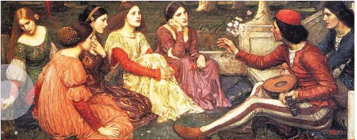
A Tale from the Decameron - 1916, di John William Waterhouse (1849 - 1917)